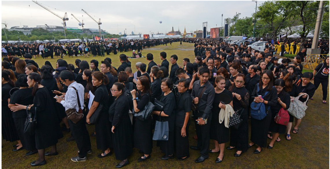
ประชาชนเข้าแถวกลางสนามหลวง เพื่อรอเข้าสักการะพระบรมศพ ในพระบรมมหาราชวังเป็นวันแรก (๒๙ ตุลาคม ๒๕๕๙)