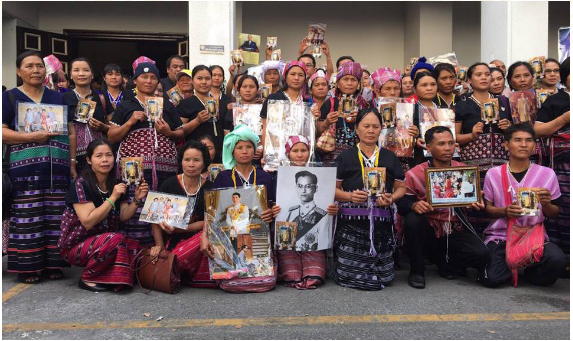
ชาวไทยภูเขาเผ่าต่างๆ มาสักการะพระบรมศพ