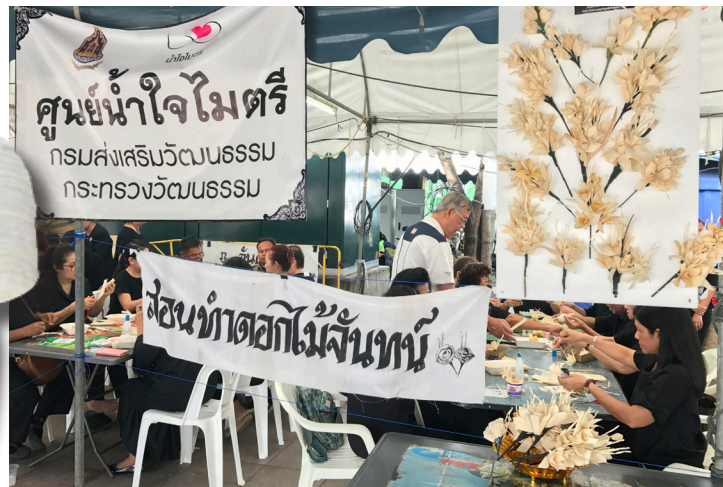
ดอกไม้จันทร์ทำจากกระดาษแบบต่างๆ ที่มีขายในท้องตลาด

งานเริ่มต้นด้วยการศึกษาข้อมูลทางอินเทอร์เน็ต แล้วออก สสำรวจบริเวณปากคลองตลาดและร้านค้าหน้าวัดที่มีการเผาศพ มาก พบว่ามีผู้ผลิตดอกไม้จันทร์รายใหญ่หลายแห่ง เช่นร้านป่าเป้า ที่บางซื่อ กรุงเทพมหานคร บ้านบางขุนกอง จังหวัดนนทบุรี บ้านเจริญธรรม อำเภอวิหารแดง จังหวัดสระบุรี บ้านวังรี จังหวัดนครนายก ส่วนใหญ่ใช้วัสดุกระดาษ และมักจะทำแบบ คล้ายกันคือดอกกุหลาบโบราณ