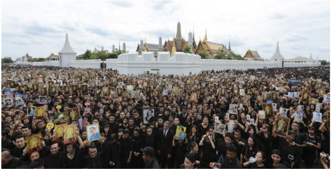
๑๔ ตุลาคม ๒๕๕๙ ประชาชนมากมายคอยถวายสักการะ ขบวนรถอัญเชิญพระบรมศพจากโรงพยาบาลศิริราชมายังพระบรมมหาราชวัง