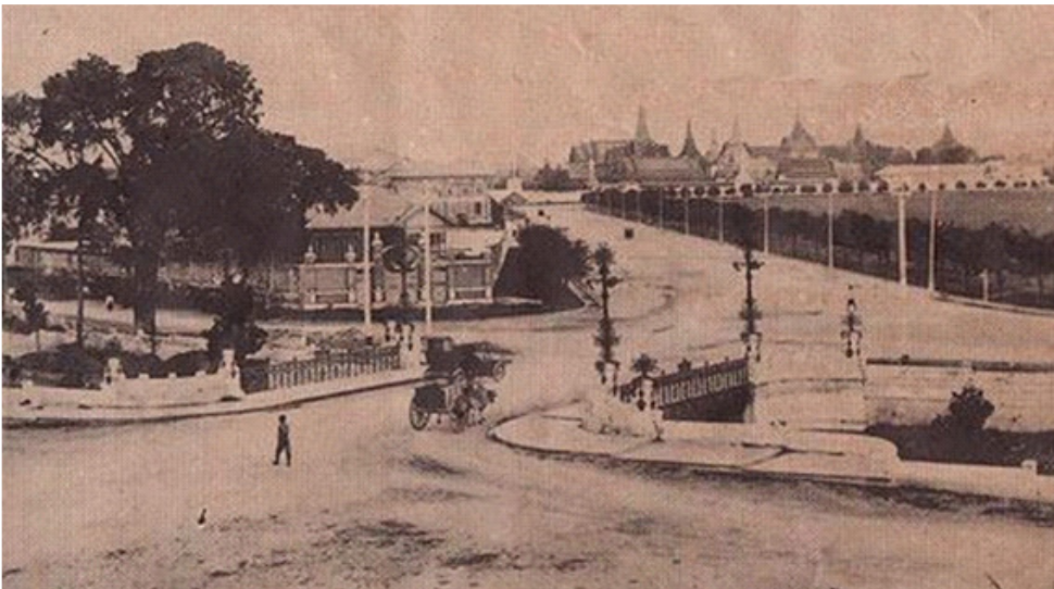
ต้นไม้ขามสนามหลวงสมัยรัชกาลที่ ๕-๖