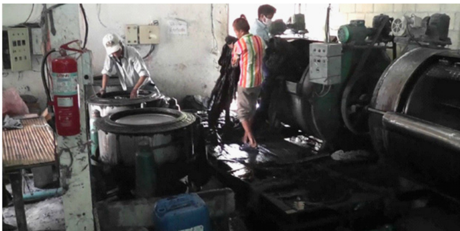
เครื่องย้อมผ้าขนาดใหญ่ทันสมัย ที่โรงเกลือ จังหวัดสระแก้ว

ในตอนแรก กลุ่มเสื้อดำ ได้นำเสื้อดำไปแจกให้คนที่ใส่เสื้อสีต่างๆ ที่ห้องสนามหลวง แต่ประสบปัญหาเพราะคนที่มีเสื้อดำอยู่แล้วก็มาขอด้วยเนื่องจากมีเสื้อดำเพียงตัวเดียวไม่พอใช้ แล้วต่อมาส่งไปแจกตามต่างจังหวัดเช่น พิษณุโลก ลำปาง แต่แจกได้เพียงไม่กี่วัน เสื้อดำที่กลุ่มเสื้อดำจัดหา ๒,๐๐๐ ตัว ก็หมดลง และไม่มีเงินมากพอที่จะจ่ายค่าย้อมผ้าและค่าขนส่งต่อไปอีกได้ กิจกรรมแจกเสื้อดำของศูนย์น้ำใจไมตรีจึงต้องยุติลง